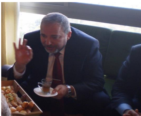
שר החוץ ליברמן עם שגרירים בפרוייקט