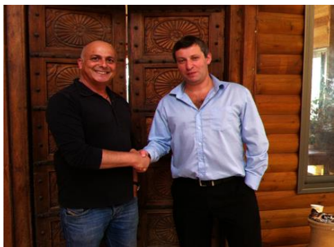
שר התיירות סטס מיסז'ניקוב