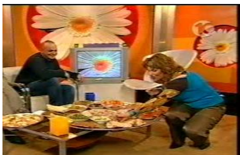
אודטה אהבה מאד את האוכל שלנו