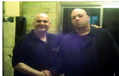
שדרן הספורט רון קאופמן